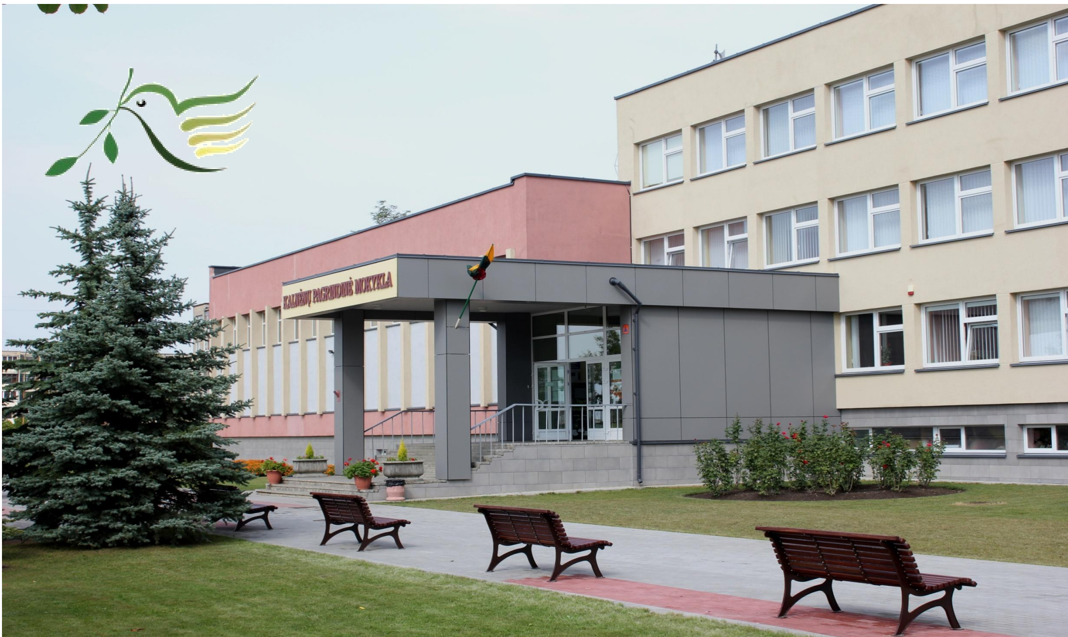
Mažeikių Kalnėnų pagrindinė mokykla. Lietuva KALNENU BASIC SCHOOL OF MAZEIKIAI, LITHUANIA